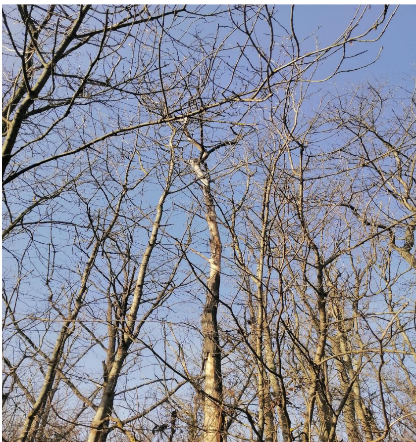
ГБУ ДНР «Приазовский лесхоз», Азовское лесничество, квартал 12 выдел 5, координаты 47.181985,37.296776