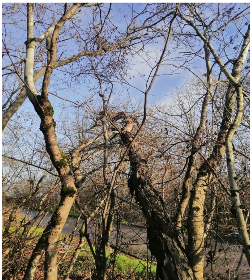
ГБУ ДНР «Приазовский лесхоз», Азовское лесничество, квартал 12 выдел 5, координаты 47.180959,37.296770