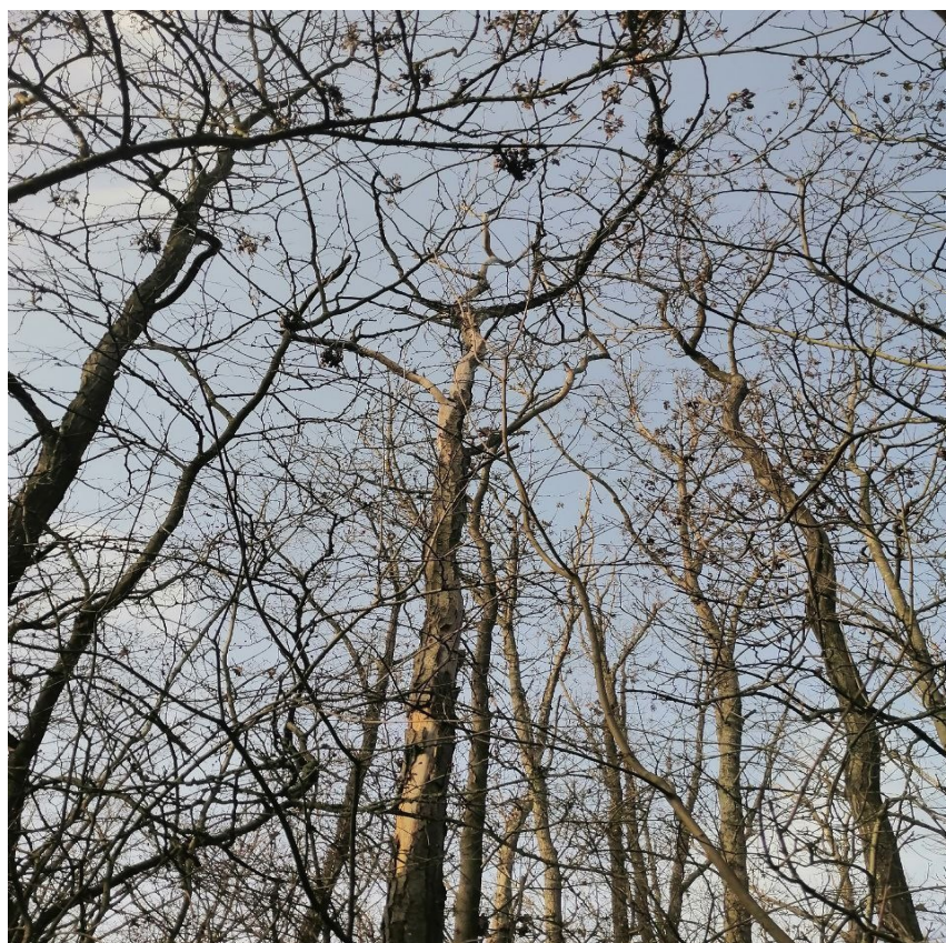
ГБУ ДНР «Приазовский лесхоз», Азовское лесничество, квартал 12 выдел 5, координаты 47.181081,37.296760